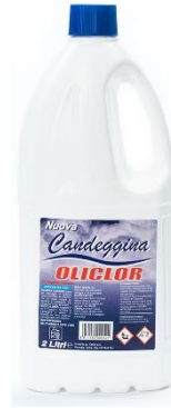
CANDEGGINA 2 LITRI