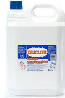
CANDEGGINA 5 LITRI