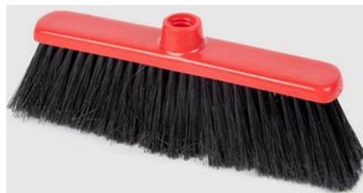
SCOPA PER INTERNI