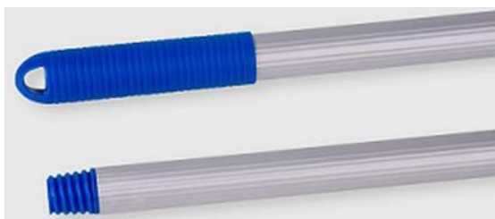
MANICO ALLUMINIO 1,30