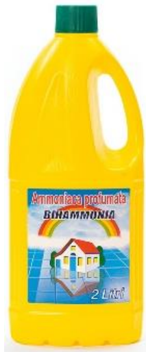
AMMONIACA PROFUMATA 2 LITRI