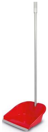
Paletta alzaimmondizia PROFESSIONAL