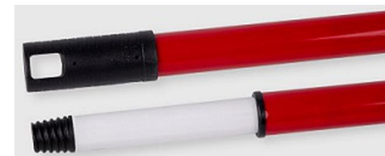
MANICO ALLUNGABILE MT.3