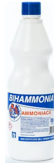
AMMONIACA 1 LITRO