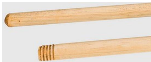
MANICO IN LEGNO MT. 1,30