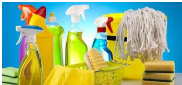
IGIENE E PULIZIA

Su richiesta codice MEPA unico per piu' articoli anche in vari settori merceologici