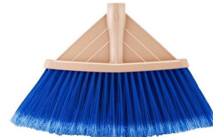
SCOPA PER ESTERNI