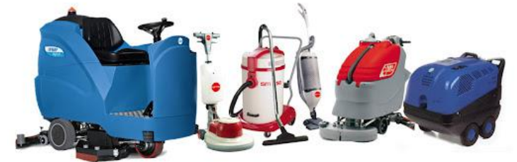
MACCHINE PER LA PULIZIA